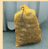
Filet filtrant SPHEROFLO®

Conçu par PURFLO pour un haut niveau de rétention des éléments grossiers issus de la fosse septique (toutes eaux), il permet une meilleure protection des épandages et filtres à sable.